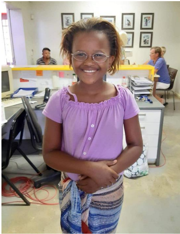
Glada mottagare av glasögon.